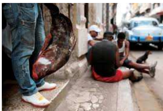
KUBÁNSKÉ HOSPODÁŘSTVÍ (za rok 2009, v USD)